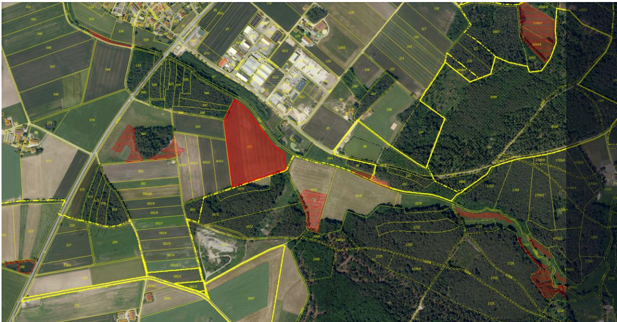
Abbildung 1: Auszug aus Biotopkartierung