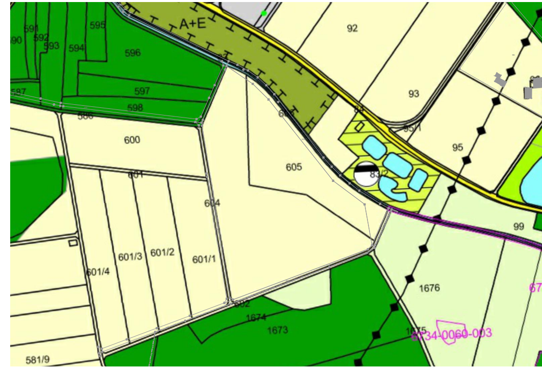
Rechtswirksamer Flächennutzungsplan vor der Änderung