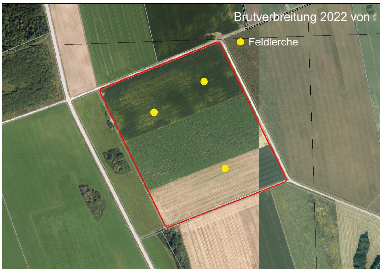
Abbildung 2: Brutverbreitung der Feldlerche im Projektgebiet

Beeinträchtigungen sind somit für Feldlerche (3 Brutpaare) gegeben. Für diese Art sind entsprechende Vermeidungs- und Minimierungsmaßnahmen zu ergreifen, da deren lokale Population nicht gesichert ist.